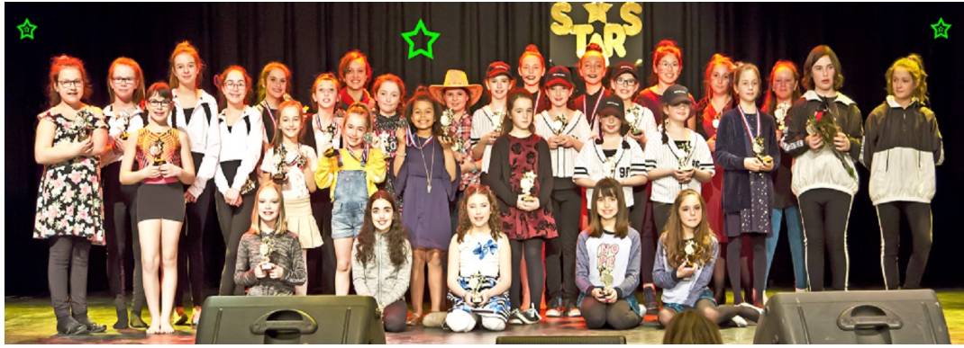
Concours Mini-Stars 2019